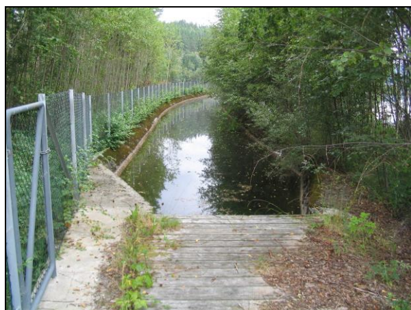
Inntak i Kloumannsjøen.