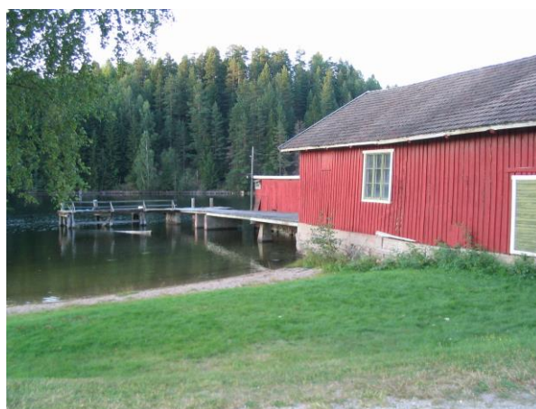
Verksted og brygge på Strengen.