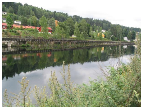
Mot nedre ende på Øvre Tinfos.