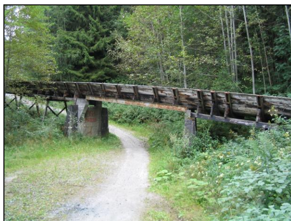
Over veg et stykke nede i renna.